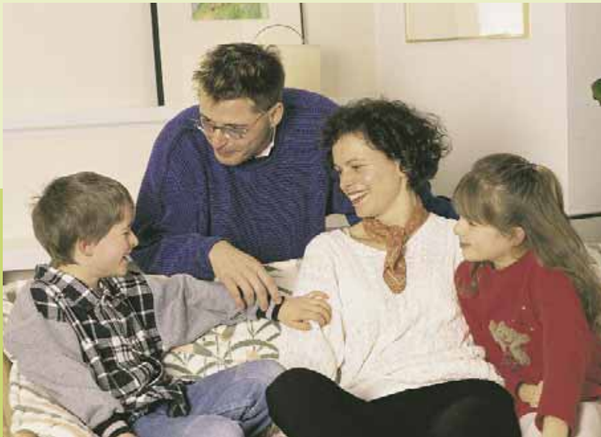
Lob oder Belohnung fördern sicherheitsbewusstes Verhalten

Erfahrene Kinderpsychologen, Pädagogen und Verkehrssicherheitsexperten haben für Sie die folgenden Hinweise zusammengestellt. Sie erheben natürlich keinen Anspruch auf Vollständigkeit, sondern sollen Ihnen lediglich einige Anregungen geben, wie Sie Ihr Kind vor Gefahren bewahren können.