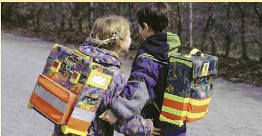
Helle Kleidung und Reflektoren an der Schultasche machen Ihr Kind besser sichtbar