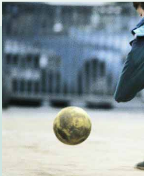
Trotz aller Vorsorgemaßnahmen sind Unfälle nie auszuschließen

Dies sind nur einige Beispiele, die zeigen sollen, dass Ihr Kind nach einem Unfall bestmöglich versorgt ist. Über den Gesamtumfang unserer Leistungen und die gesetzlichen Voraussetzungen, die erfüllt sein müssen, informieren wir Sie gerne ausführlich. Wie Sie uns erreichen, entnehmen Sie bitte der vorletzten Seite.