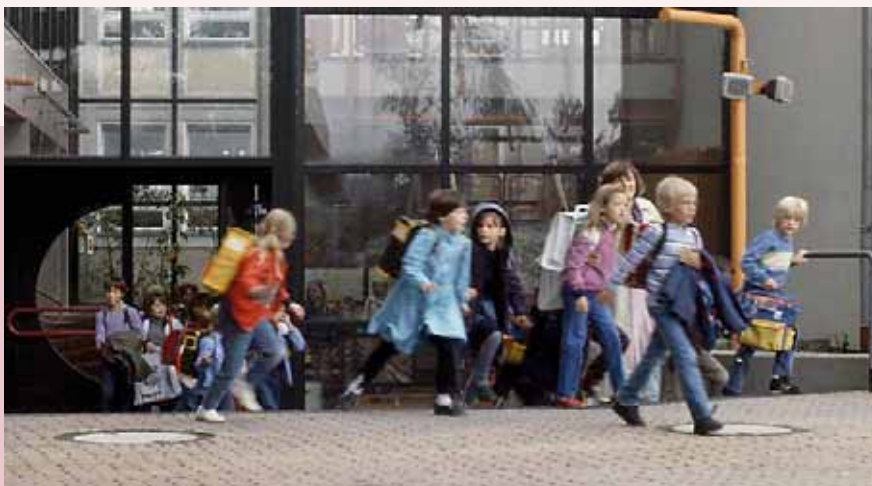
Bei uns ist ihr Kind gut versichert – sei es in der Schule ...

Ihr Kind ist außerdem versichert, wenn es Wege von und zu dem Ort, wo der Unterricht oder andere schulische Veranstaltungen stattfinden, zurücklegt. Für den Versicherungsschutz spielt es keine Rolle, ob der Schulweg zu Fuß, mit Bussen und Bahnen, mit dem Fahrrad oder mit dem Auto erfolgt. Dies gilt auch bei Fahrgemeinschaften. Der versicherte Weg muss nicht der kürzeste sein, wenn ein anderer Weg gewählt wird, der verkehrstechnisch günstiger oder risikoärmer ist.