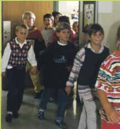
Ihr Kind sollte immer genügend Zeit haben, sonst können Angst und Stress entstehen