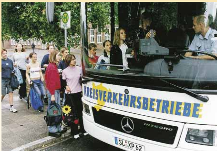
Kinder sollten erst an den Bus herantreten, wenn sich die Türen geöffnet haben