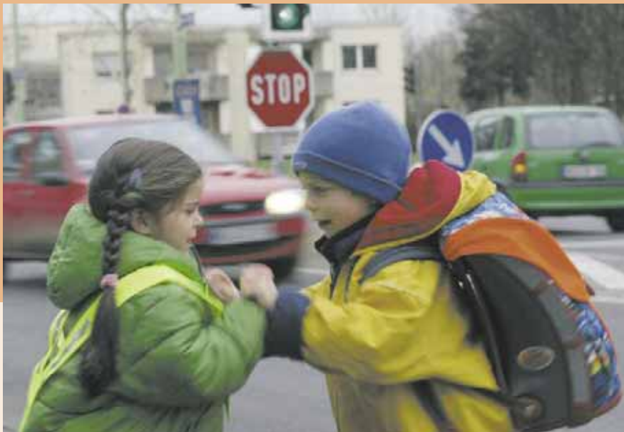
Achten Sie auf der Fahrt auf Kinder und andere „schwächere“ Verkehrsteilnehmer