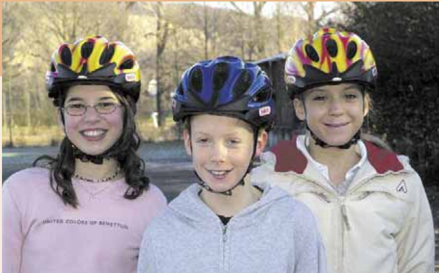
Fahradhelm und auffallende Kleidung verbessern die Sicherheit Ihres Kindes